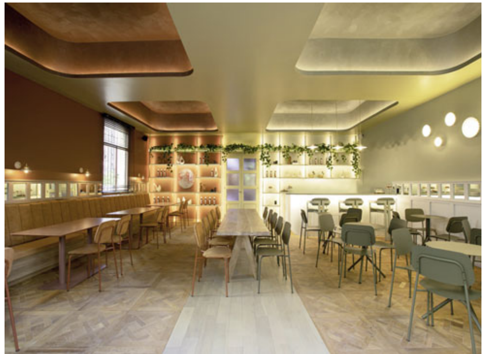
La Cafetería es un espacio de encuentro, de disfrute. Un ambiente cálido y acogedor que invita al usuario a quedarse y descansar.