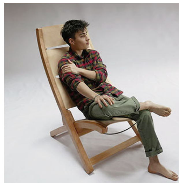
“Topa Topa” está elaborado con madera de lenga.

También se confirmó que el SMA –Salón del Mueble Argentino- este