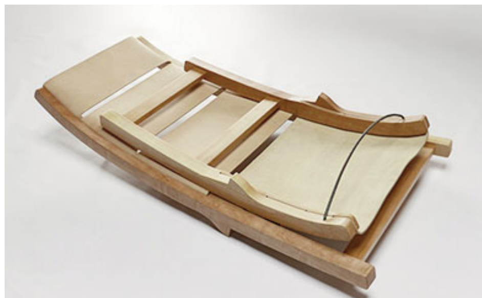
“Topa Topa” es plegable.

año incluirá el premio Asoma, que distinguirá anualmente al diseño de