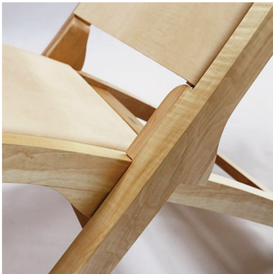
Detalle del sillón “Topa Topa”.

Equilibrio”; - Mención Producto: empresa Genoud, por “Silla Osaka”; - Comunicación Stand: empresa Mosconi; - Mención Stand: Empresa Mosconi;