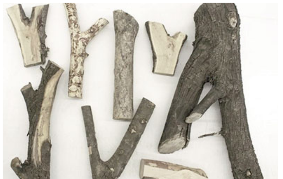
Los nudos seleccionados son procesados y fotografiados minuciosamente de forma individual.

El proyecto, que fue realizado con maderas locales, provoca un gran impacto positivo en la reducción de la huella de carbono en la agricultura local. No solamente reduce hasta diez veces el impacto medioambiental de la fabricación de una bicicleta, sino que utiliza madera que la industria desecha, otorgándole un nuevo propósito.