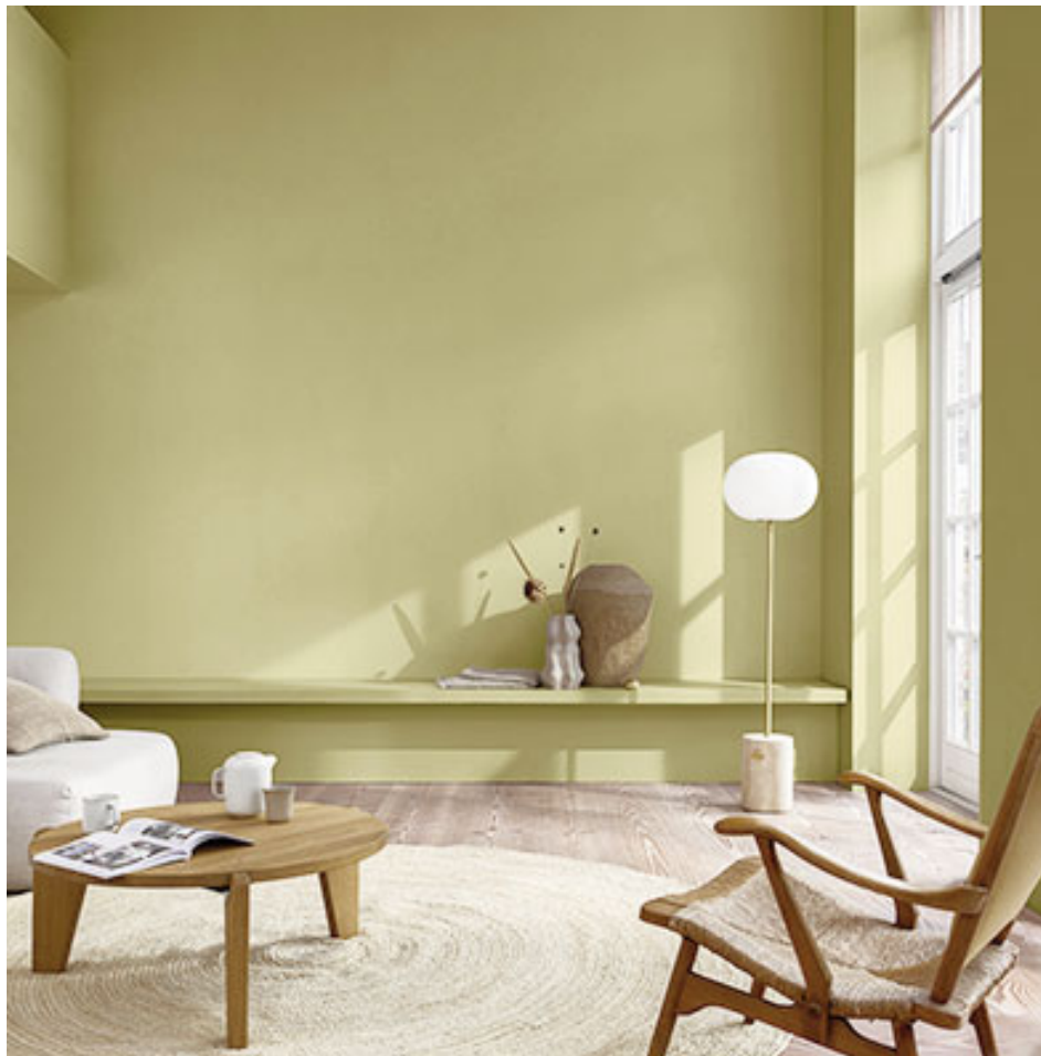
“Silencio de invierno”, color para 2023 de Alba.

Este espíritu conectó a los expertos del Centro de Estética Mundial de AkzoNobel, quienes a partir de allí se enfocaron en absorber el poder de la naturaleza y en ayudar a las personas a llevar esta magia a entornos residenciales y comerciales traducidas en cuatro paletas inspiradoras, con los tonos