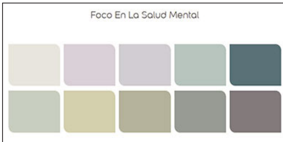
Tendencia 1 pone foco en la salud mental e incluye los colores gris generoso, azul de bohemia, verde caqui, gris hámster, caqui luminoso.