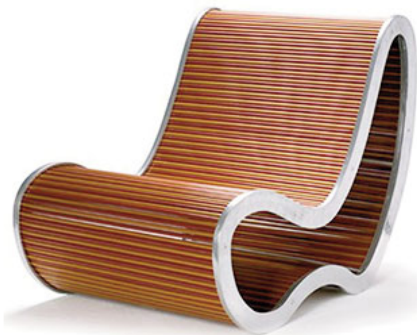
Se expusieron los productos elegidos que aspiran al Premio ASOMA Revelación.

El segundo Salón del Mueble ASOMA -SMA Buenos Aires- se desarrolló del 13 al 16 de diciem-