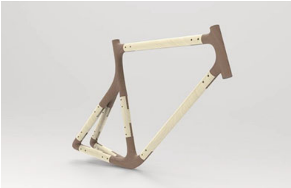
El proyecto reduce hasta diez veces el impacto medioambiental de la fabricación de una bicicleta.

anteriormente, esta propuesta fue la merecedora del primer lugar en el XI Concurso de Diseño de la Semana de la Madera 2022, atractivo que también conquistó por su intencionalidad, ya que cualquier persona que uti-