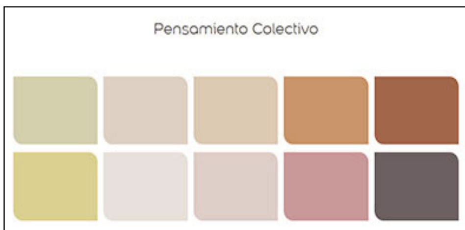
Tendencia 2 se denomina "pensamiento colectivo". Colores: extremo sur, paseo del parque, su santuario, escultura de madera.

Podemos reciclar y reutilizar, podemos cultivar y hacer compost, podemos