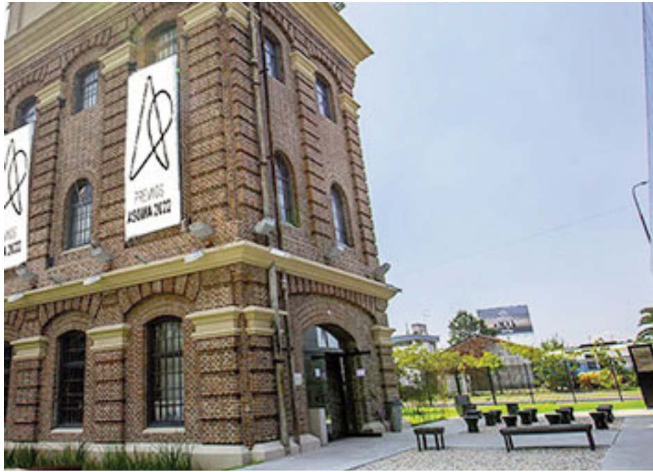
El evento se desarrolló del 13 al 20 de diciembre en MARQ.

Allí el brasileño Humberto Campana, uno de los diseñadores más reconocidos del mundo, participó en el jurado de selección de los 10 trabajos que se postularon al Premio ASOMA Revelación 2022, luego de una amplia convocatoria abierta.