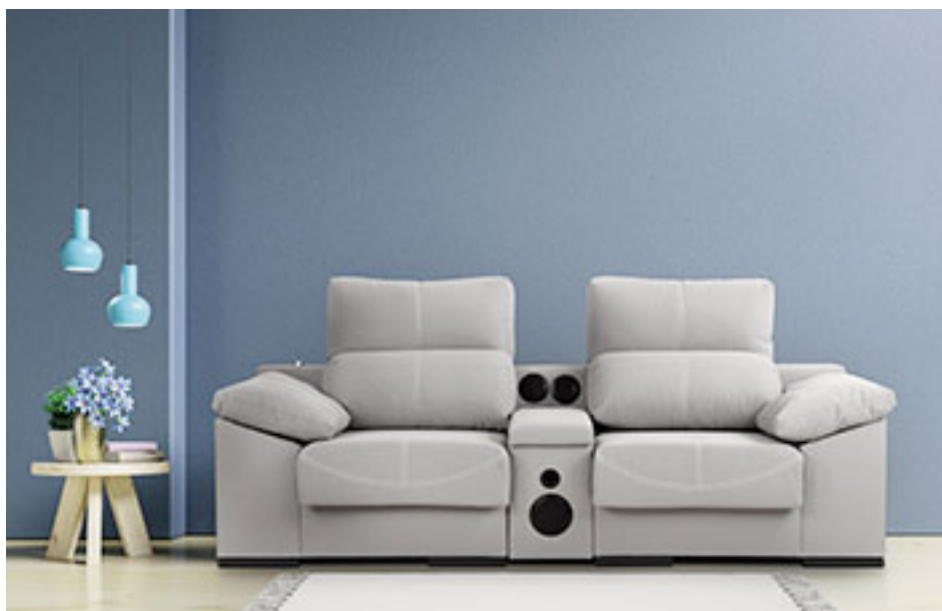
Sillón "París", con consola.

- Nadie lo tiene del todo claro. En un momento teníamos cupos y de esos cupos vos podías traer equis cantidad de dólares de insumos y la maquinaria que importabas para producir no ocupaba el cupo. Después esa maquinaria empezó a ser parte del cupo y, claro, nos consumimos de muchos meses con maquinaria que no suponíamos que ocupaban cupo. Es un círculo vicioso. Y no hay una claridad respecto de cómo lo van a resolver. Algunas cosas van saliendo sin demasiada