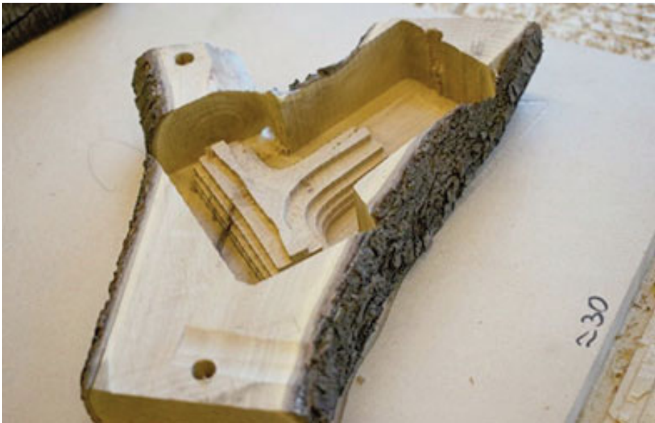
Tree Cycle obtuvo el primer lugar del XI Concurso de Diseño / Equipo ganador

“La investigación proyectual que se refleja en el proyecto da cuenta de un profundo análisis de la madera como material de construcción y aprovecha sus condiciones naturales para potenciar la construc-