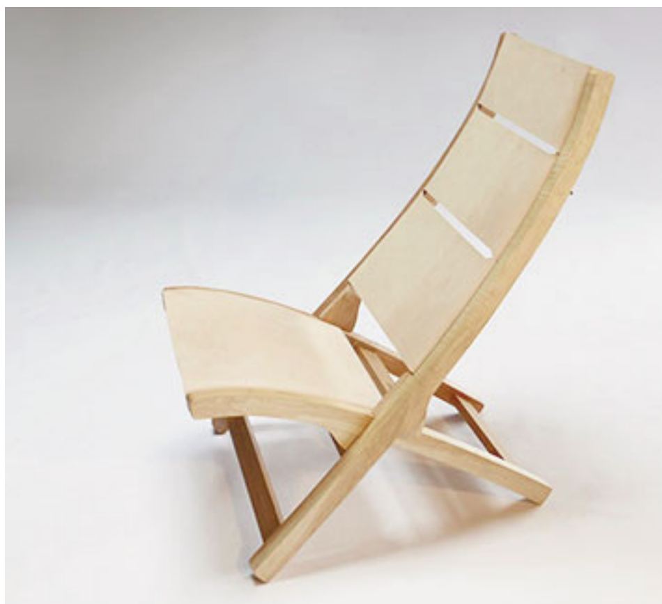
“A pesar de estar especialmente diseñado para casas de campo y glamping, por su confort y sencillez (Topa Topa) se adapta muy bien para cualquier hogar”, señalaron sus autores.

el sistema de gestión de buenas prácticas y programas sectoriales de calidad y conformidad.