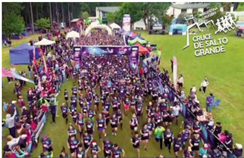
La carrera convocó a más de 100 colaboradores.

Toda la colección de diseños y productos EGGER está disponible en los puntos de venta EGGER Haus y en los Distribuidores del país y la región. También pueden acceder a la variedad de diseños, combinaciones, aplicaciones, etc. a través de la App EGGER Colección Decorativa, desde donde además podrán pedir muestras A4 de los diseños elegidos para su próximo proyecto. Además, en EGGER