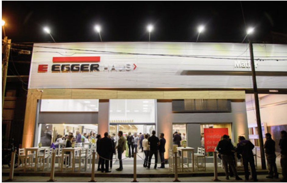
Junto al distribuidor Matfer, EGGER abrió en Salta las puertas del EGGER Haus número 43.

Entre todos y cada uno a su ritmo, corriendo, trotando o caminando, sumaron 1.285 kilómetros que se transformarán en $1.000.000 que serán destinados a obras de mejora en las instalaciones de la escuela primaria N°77 "Néstor Kirchner", ubicada frente a la planta industrial de EGGER.