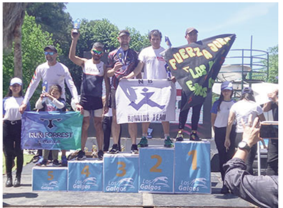
Ganadores del evento.

Egger Runs en Argentina, y desde allí cada vez más colaboradores se suman a