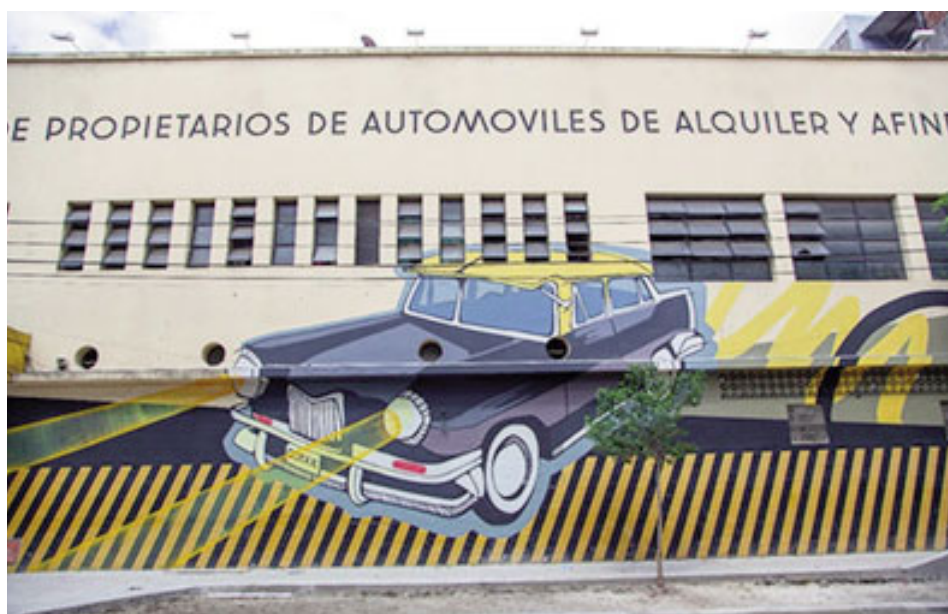
Mural ubicado en Cotax, sobre Agüero entre Sarmiento y Valentín Gómez

polo de la cultura independiente, la iniciativa forma parte de un proyecto integral en el que intervienen