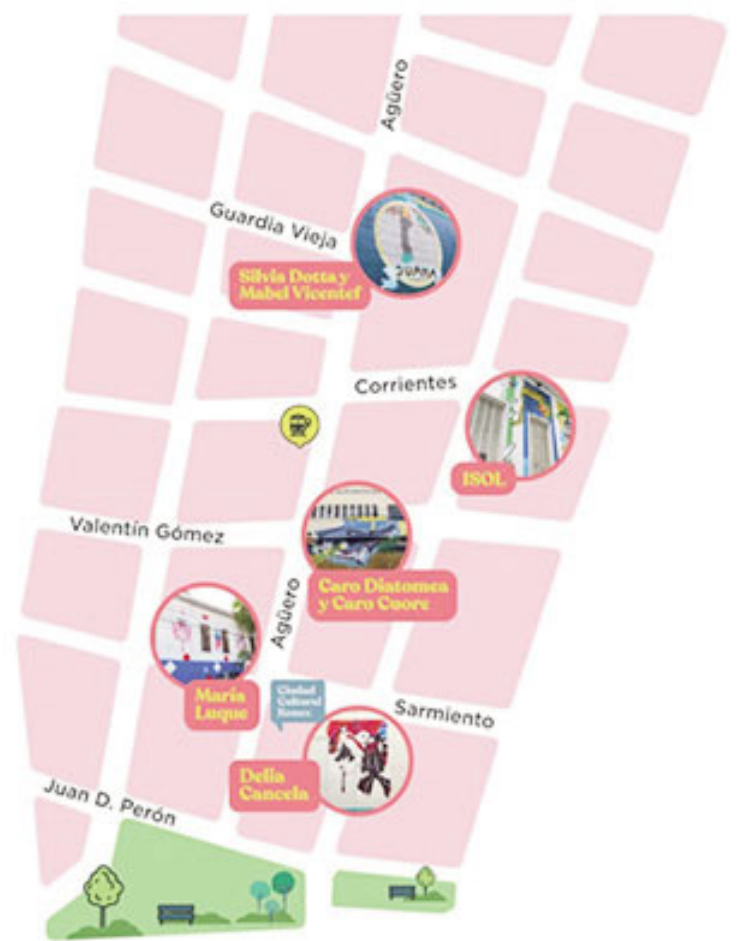
Circuito de murales del Abasto.

La artista realizó también otras dos esculturas de las mismas característi-