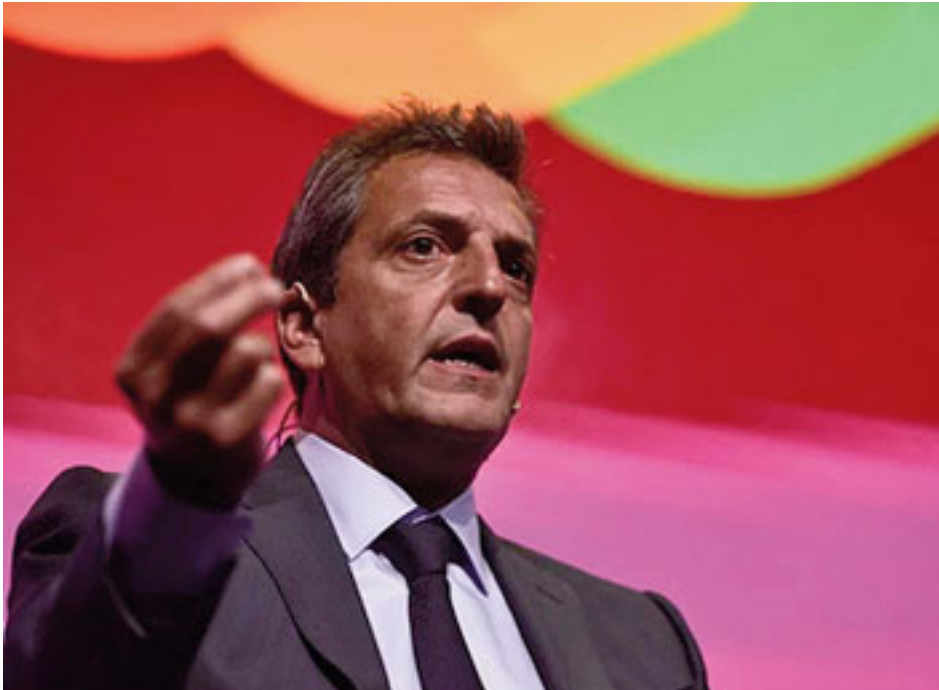
Sergio Massa, ministro de Economía.

De esta manera, se confirmó el pago de bono de fin de año a trabajadores registrados. La posibilidad se venía manejando desde hace meses, algo que manifestó tanto el presidente Alberto Fernández como varios de los ministros, entre ellos Raquel "Kelly" Olmos (Trabajo), Ignacio de Mendiguren