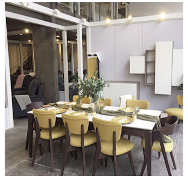
Exhibición de un juego de comedor en local de Tucumán.

- Tenemos muchas innovaciones en marcha y muchas otras en carpeta. Más que nada trabajaremos sobre los puntos de