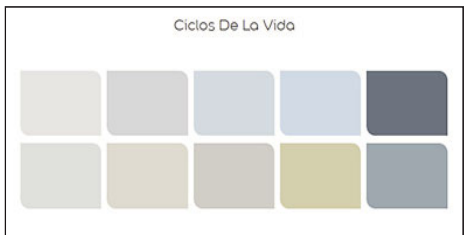
Tendencia 4 alude a ciclos de la vida y se manifiesta en los colores trofeo de plata, gris fantasma, casual jeans, ballena boreal.

Para incorporar la inspiración de nuestro Color del año, elegimos el nombre Silencio de Invierno™: