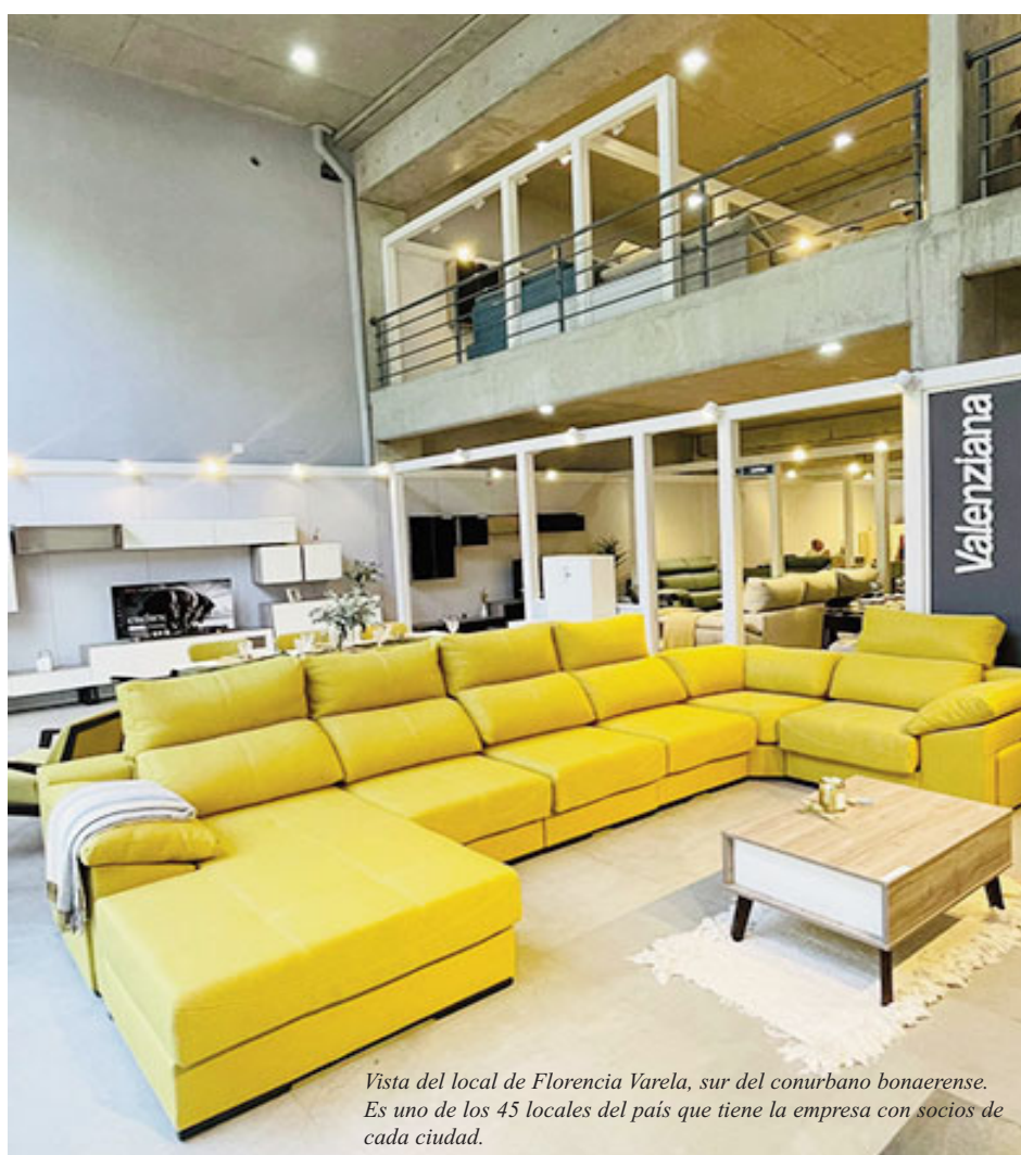
Vista del local de Florencia Varela, sur del conurbano bonaerense. Es uno de los 45 locales del país que tiene la empresa con socios de cada ciudad.

- Hoy se están adaptando a la nueva realidad. Entonces los nuevos pro-